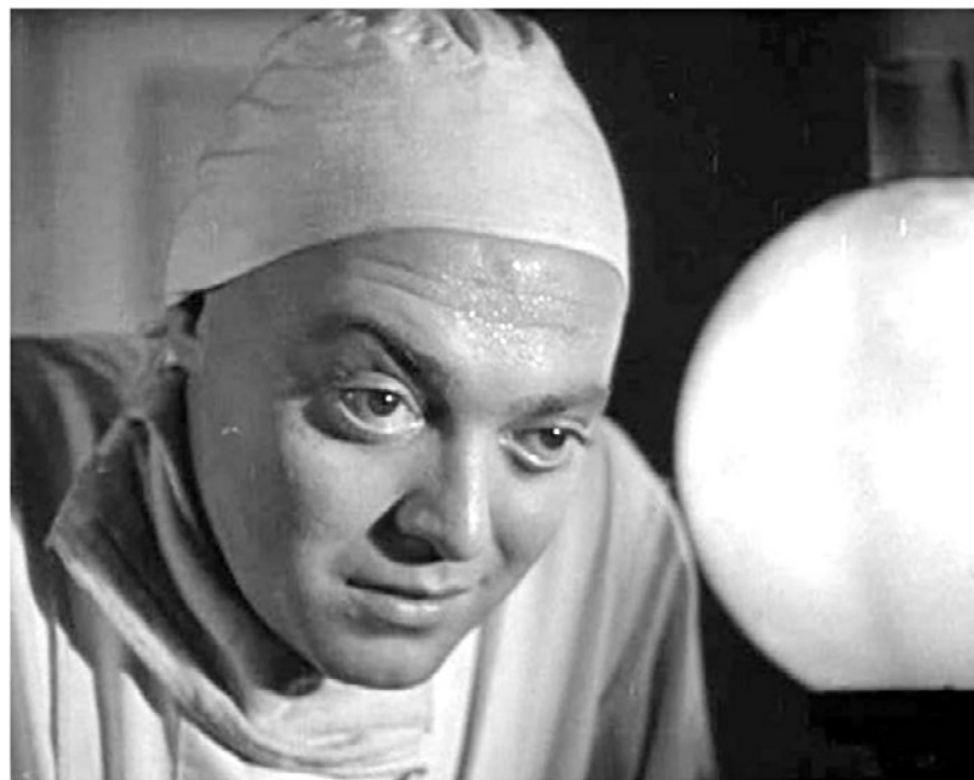
פיטר לורה כד"ר גוגול ב"אהבה משוגעת" (1935)

"סלמאן רושדי סיפר שכלד במומבאי הוא ראה את 'הקוסם מארץ עוץ', ושם נולד החלום להגר למקום שבו אין בעיות. הוא שולל מכל וכל את העמדה המוסרנית של 'אין כמו בבית' - לברוח מקנזס!"