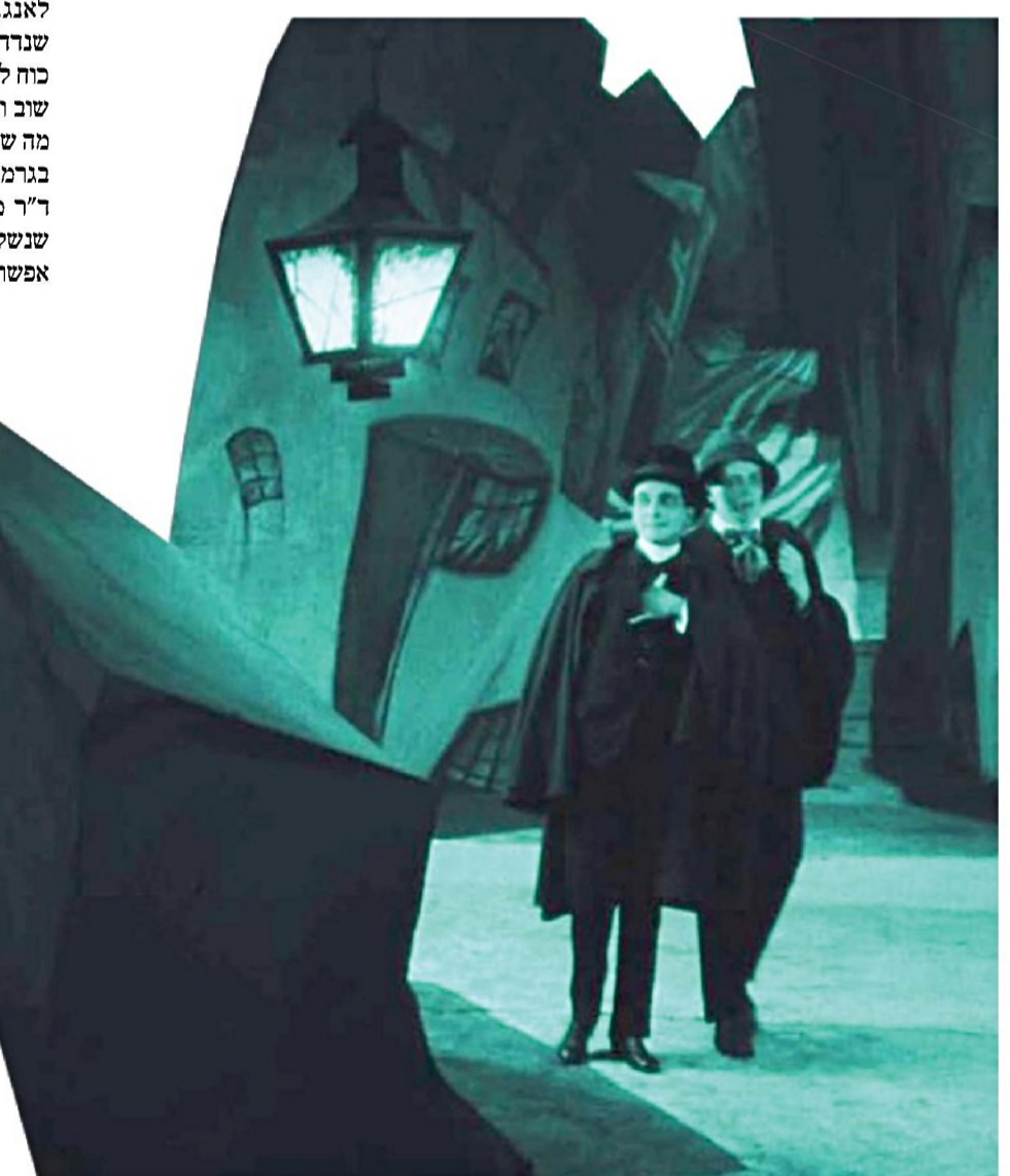
צילומים: מתוך הסרטים

"גוף היצירה ההוליוודי בין שתי מלחמות העולם הוא אוצר הטקסטים היהודי הגדול ביותר שנוצר מחוץ לגבולות ארץ ישראל. איפה יש עוד מקום כזה, או גילדה כזאת, שבהם באופן מובהק בעלי המאה שהם גם בעלי הדעה הם יהודים?"