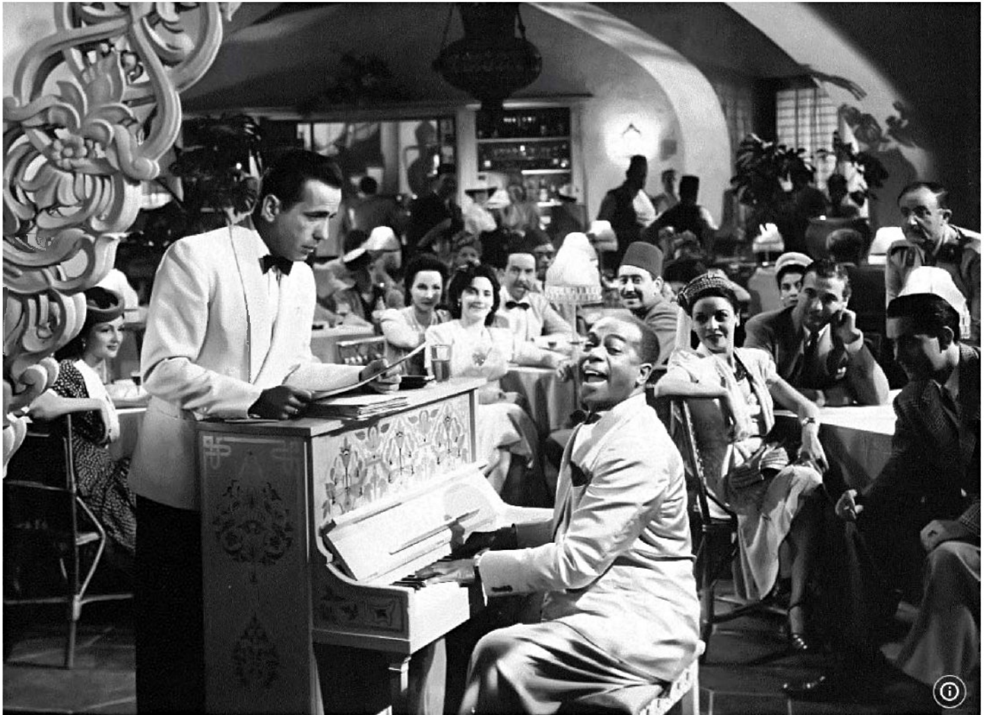
מתוך "קזבלנקה" (1942)